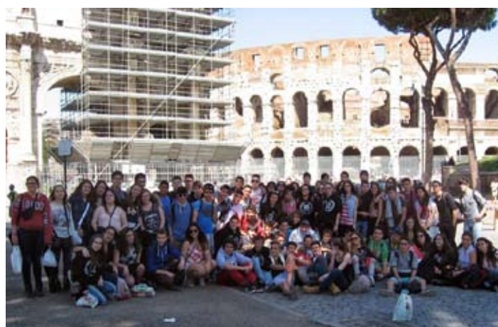
Viatge a Roma

LA REVISTA - 3r Trimestre curs 2013-2014 - Santa Coloma de Farners Correu electrònic: revista@iessantacoloma@gmail.com Edita: Institut de Santa Coloma de Farners Imprimeix: AG Cantalozella Dipòsit Legal: GI-242/2009