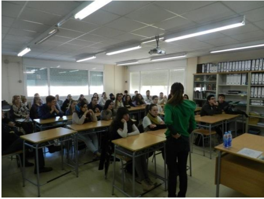
Experiència emprenedora – Llagurt