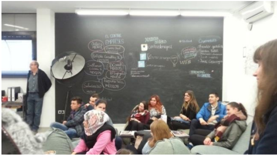
Visita "El Centre" - Eix de negoci