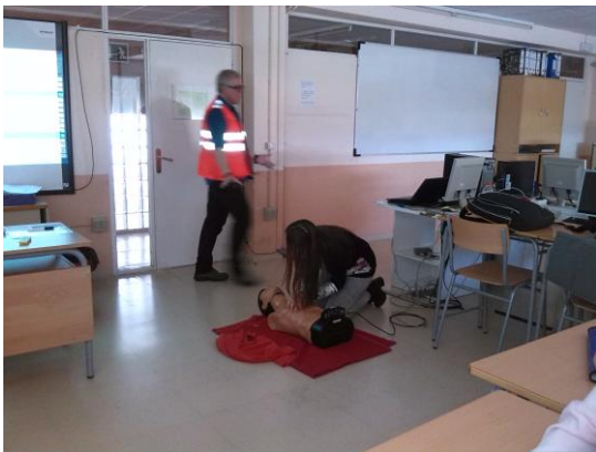
Taller de la Creu Roja