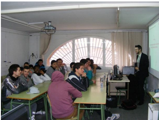
Xerrada - UNEX