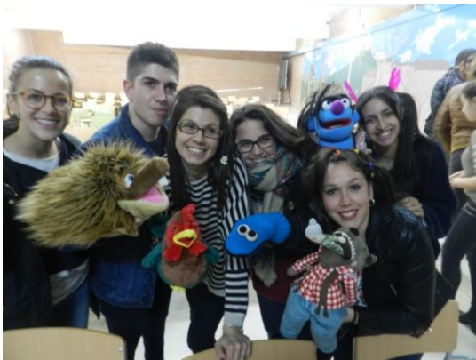
Taller de teatre i contes