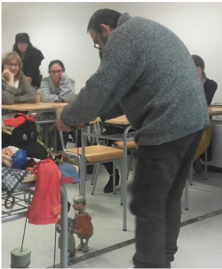
Taller de Titelles