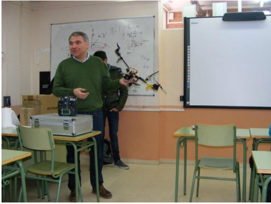
Drons i Càmeres