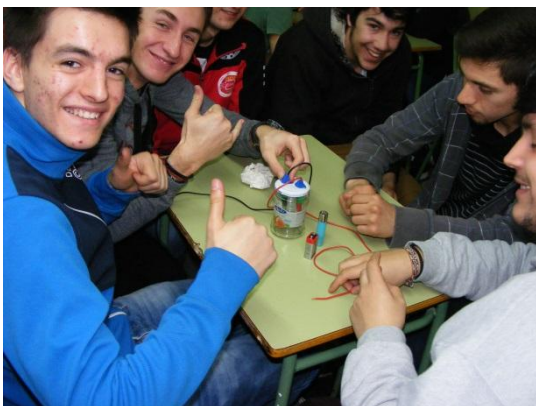
Museu de l'Electricitat