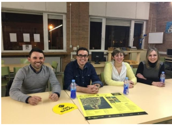
Taula Rodona - Ex-alumnes emprenedors