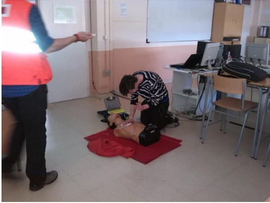
Taller de la Creu Roja